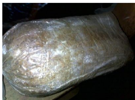
a). Perlakuan A (kontrol)