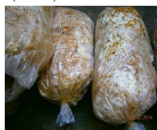
b). Perlakuan B dengan substrat jerami